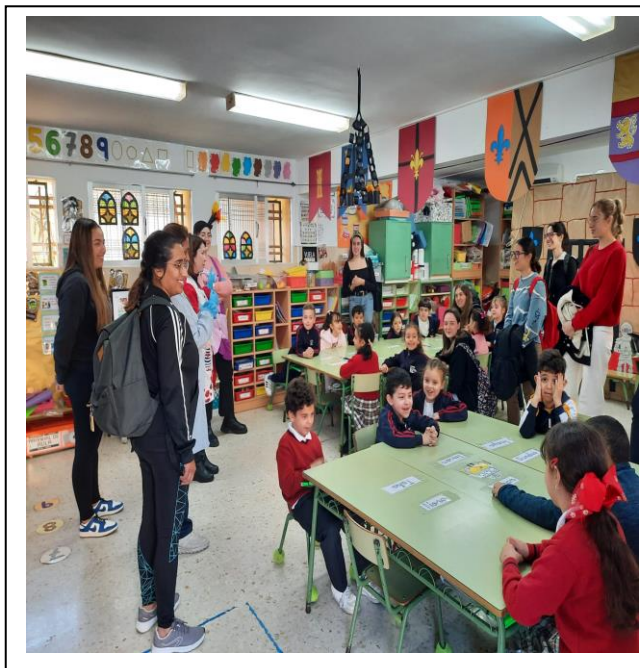
Visita clase CEIP Interior de clase

Como resultado, las alumnas quedaron entusiasmadas con la posibilidad de interactuar con alumnos reales de educación infantil y les propusimos que empezaran a pensar cómo abordar una intervención educativa desde diversas asignaturas (Inglés, nutrición, motricidad...) usando como hilo conductor leyendas vinculadas a Ceuta.