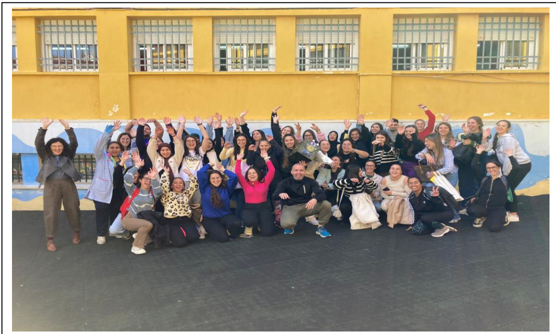
Visita Colegio Rosalía de Castro, foto de grupo en el patio de motricidad de infantil, con la caja de deseos de los alumnos del centro.

Una vez conocidas ambas realidades se empezó a trabajar conjuntamente con los alumnos y el resto del profesorado las actividades que se podrían llevar a cabo para generar un evento motivador que sirviera de colofón a lo trabajado en el CEIP.