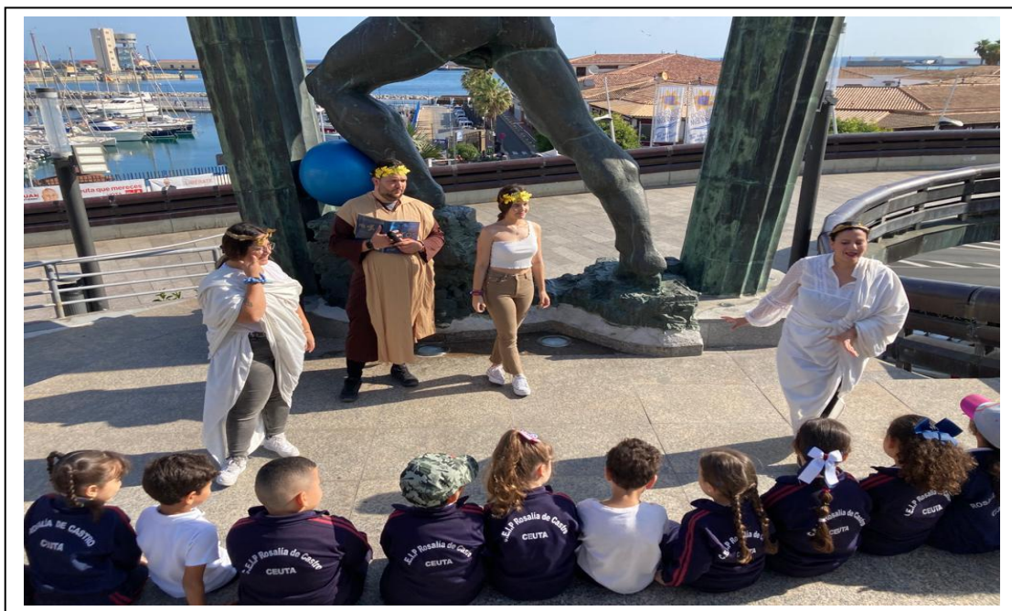
Representación teatral interactiva sobre las leyendas de Hércules, evento final.

Antes de que se llevaran a cabo las pruebas seleccionadas, los alumnos de infantil fueron recibidos a su llegada en bus por alumnos de la FEEET de Ceuta disfrazados de griegos y con música triunfal de fanfarrias. Los pequeños fueron conducidos hasta la grada situada tras la estatua de Hércules en el centro de la ciudad, que sirvió de inmejorable escenario para presentar sus aventuras, mediante una representación teatral organizada por los estudiantes de la FEET, que deleitaron a los niños y les hicieron interactuar, y mostrar sus dotes de expresión corporal, conocimiento e improvisación durante el desarrollo del teatro, a la vez que se asentaban los conocimientos trabajados en clase mediante juegos motores.