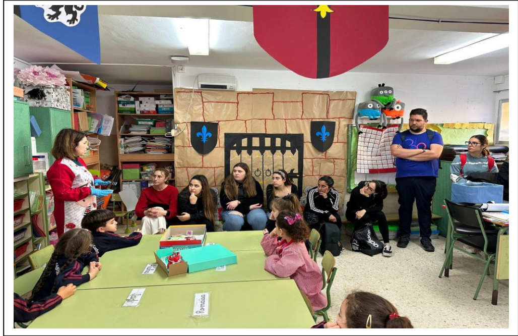
Alumnos de la facultad en el CEIP Rosalía de Castro