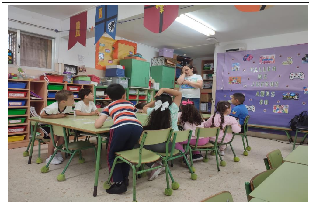
Visita profesorado Ugr al CEIP Santa Amelia