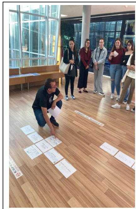
Visita guiada realizada por Turismo Ceuta sobre Mitología

Más adelante se desarrollará el contenido del evento en el que se trabajaron actividades para trabajar de forma transversal e interdisciplinar contenidos tan