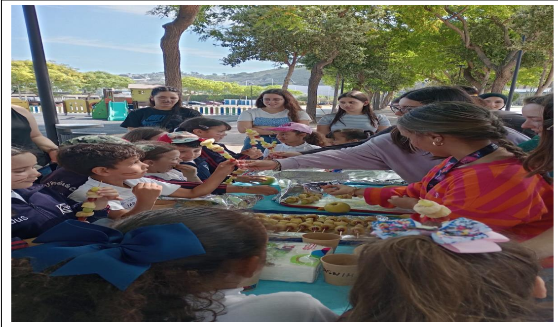
Reparto de desayuno saludable, tras superar las pruebas de Hércules

Para finalizar el agotador día después de superar algunos de los trabajos que el mismísimo Hércules realizó en Ceuta, los alumnos pudieron degustar unas maravillosas brochetas de frutas realizadas por los que fueron sus profesores (alumnos de la FEET) no sin antes reflexionar sobre la importancia de la fruta y la alimentación en una vida saludable y por supuesto, repasar los nombres de esas frutas en inglés.